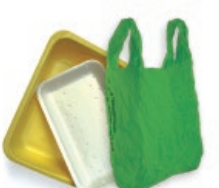
Porexpanezko erretiluak eta plastikozko poltsak / Bandejas de porexpan y bolsas de plástico