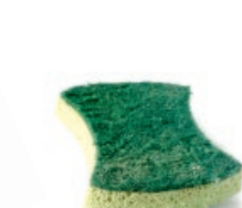
Espartzua / Estropajo