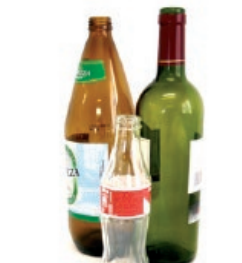
Beirazko botilak / Botellas de vidrio

EL RESTO AL CONTENEDOR GRIS EREFUSA EDUKIONTZI GRISERA