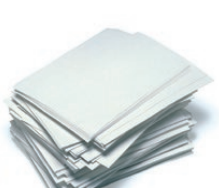
Paperezko orriak / Hojas de papel