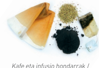
Kafe eta infusio hondarrak / Marro del café y restos de infusiones