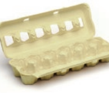
Kartoizko arrautza-ontziak / Hueveras de cartón

LOS ENVASES DE VIDRIO, AL VERDE BEIRAZKO ONTZIAK, BERDERA