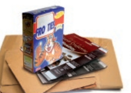
Kartoizko kaxak eta ontziak / Cajas y envases de cartón

Recicla el papel y cartón bien plegado y sin bolsas de plástico Birziklatu papera eta kartoia, ongi tolestuta eta plastikozko poltsarik gabe