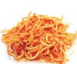
Sukaldatutako janaria (pasta, arroza, ...) / Comida cocinada (pasta, arroz...)