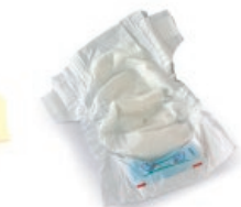
Pixoihalak eta konpresak / Pañales y compresas