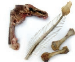
Haragi eta arrai hondarrak / Restos de carne y pescado