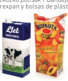
Brikak / Bricks

LOS ENVASES DE PAPEL Y CARTÓN, AL AZUL PAPERA ETA KARTOIZKO ONTZIAK, URDINERA