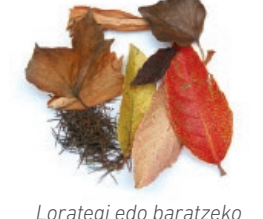
Lorategi edo baratzeko hondarrak / Restos del jardín o de la huerta

LOS ENVASES LIGEROS, AL AMARILLO ONTZI ARINAK, EDUKIONTZI HORIRA