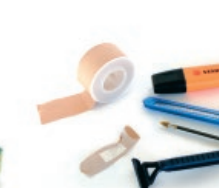
Besteak / Otros