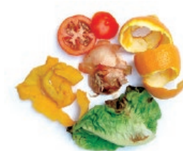
Barazki eta fruta hondarrak / Restos de fruta y verdura

Recicla la orgánica usando siempre bolsas compostables Birziklatu organikoa, beti poltsa konpostagarriak erabiliz