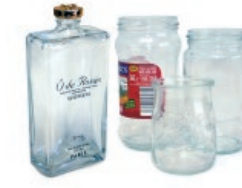
Beirazko ontziak / Tarros de vidrio

Recicla el vidrio sin tapas ni tapones Birziklatu beira, tapa eta tapoirik gabe