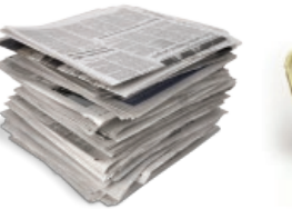
Egunkariak eta aldizkariak / Periódicos y revistas