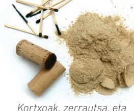
Kortxoak, zerrautsa, eta pospoloak / Corchos, serrín y cerillas