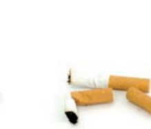
Zigarrokinak / Colillas de cigarros