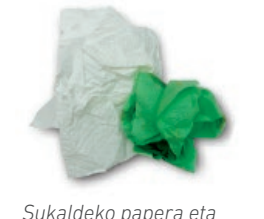
Sukaldeko papera eta musuzapiak / Papel de cocina y servilletas