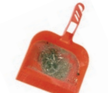
Errazte-hondarrak / Restos de barrido