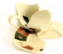
Zeramika hondarrak / Restos de cerámica

Productos que no se pueden reciclar Birziklatu ezin diren produktuak