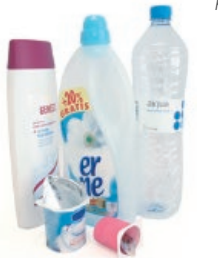
Plastikozko ontziak / Envases de plástico