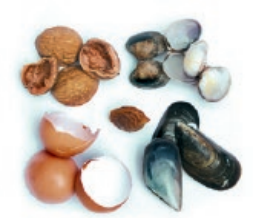
Arrautza eta marisko oskolak, fruitu lehorrak / Cáscaras de huevo, frutos secos y marisco