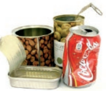
Latak / Latas

Recicla los envases quitándoles el aire para reducir el volumen Birziklatu ontziak, airea kenduta, bolumena txikitzeko